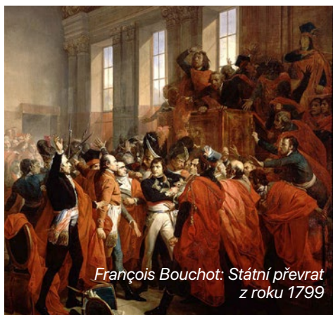
François Bouchot: Státní převrat z roku 1799

V roce 1789 došlo k vyvolání revoluce kvůli rostoucí nespokojenosti obyvatelstva s vládou Ludvíka XVI., který čelil rostoucímu zadlužení a neudržitelným ekonomickým problémům. V květnu 1789 byly svolány Generální stavy. Po útoku na Bastilu 14. července 1789, symbolu monarchistické moci, začala revoluce, která ovlivnila navždy dějiny. Napoleon Bonaparte, v roce 1789 teprve 20letý mladý důstojník, byl na vojenské akademii v Paříži a ne přímo zapojen do počátečních revolučních událostí. Nicméně, revoluční ideály jako rovnost, svoboda a bratrství jej oslovily a v roce 1791 byl již aktivně zapojen do vojenských a politických změn, které probíhaly po pádu Bastily.