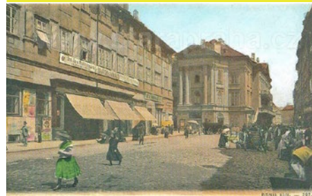
Stará Praha s Prahou!

Old Town was also known for its markets such as „Ovocný trh“ (fruit market) and „Vaječný trh“ (egg market) in Rytířská street (where ACGA is located). Another famous street located next to ACGA is called „V Kotcích“.