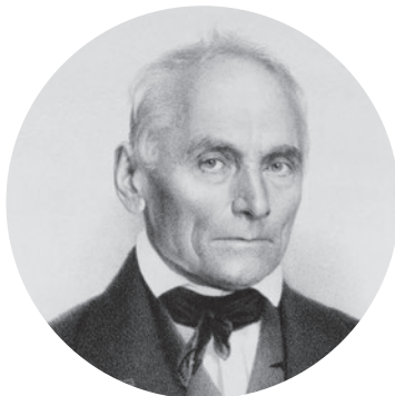
Jan Evangelista Purkyně

1621 – anglický parlament v Londýně jednomyslně schválil přechod k protestantství. Tento krok upevnil postavení anglikánské církve, která byla založena již v roce 1534 za vlády Jindřicha VIII., ale v následujících desetiletích musela čelit silnému tlaku ze strany katolíků a puritánů.