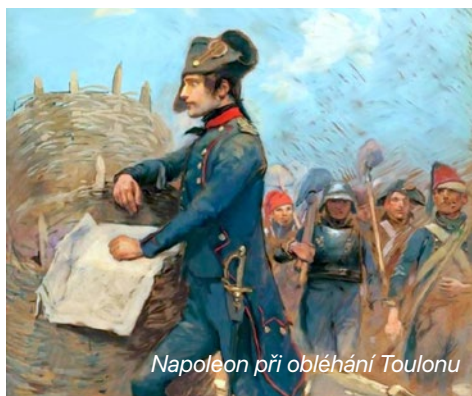
Napoleon při obléhání Toulonu

V roce 1785, když Napoleon dokončoval studium na vojenské akademii v Paříži, zemřel jeho otec Carlo. Pro tehdy šestnáctiletého Napoleona to byla těžká rána. Ztratil svého největšího mentora a musel se postavit do role toho, kdo bude rodinu na dálku podporovat. Po otcově smrti převzala rodinné záležitosti jeho matka Letizie, kterou Napoleon vždy obdivoval pro její sílu a disciplínu. I přes složitou finanční situaci se rozhodl zůstat v armádě a soustředit se na svůj vlastní rozvoj.